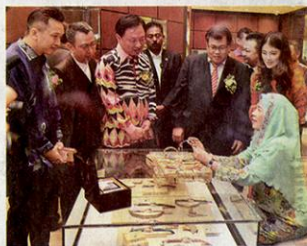
国家元首后后欣赏着精致的手表。

【檳城訊】全国首个艺术与文整合的M商场O2O，周日在国家元首后后哈莉曼莅临见证下正式揭开序幕，该商场开幕之余不忘履行企业社会责任，捐献50万令吉予国家元首后后孤儿基金会，为社会献爱心。