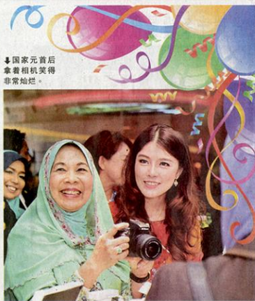
国家元首后后拿着相机笑得非常灿烂。