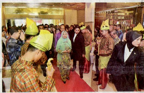
国家元首后后哈莉曼抵达M商场开幕礼现场，嘉宾们全体竖立敬礼，以示尊敬。

国家元首后后哈莉曼随后移交现金及礼篮予2015年在PT3考试中取得优秀成绩的孤儿们。出席开幕礼的嘉宾尚有理力产业集团总裁拿督刘永福、拿督张晋发夫人拿汀周佳嘉、EBC City Group首席执行官拿督陈意生，以及ECK Group首席执行官拿督许永铨太平局坤等人。