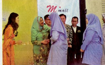
国家元首后后哈莉曼随后移交现金及礼篮予在2015年PT3考试中取得优秀成绩的孤儿们。

站式的购物、餐饮、休闲、娱乐及消遣的好去处。 商场主题购物区拥有各国商品 商场的主题购物区拥有来自日本、韩国、美国、泰国、中国、香港及马来西亚的商品，享受丰富的餐饮选择，从传统的味道到全新的美食体验，应有尽有。另外，超过300家保健、美容、时尚及资讯科技商店，满足您所有的购物需求。您可漫步于生活与文化区，品尝东京最新潮流，沉醉于韩国的精美产品，接着品尝精致的中国菜，或漫步在曼谷街头，在购物中心、咖啡馆下午茶和司康饼，享受世界各大著名城市的一切美好事物。