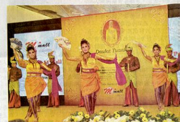
传统舞蹈秀为开场表演，舞蹈员们的精彩表演获得热烈掌声。