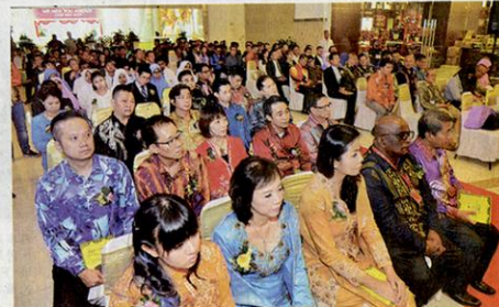
嘉宾们均以盛装出席M商场开幕典礼。