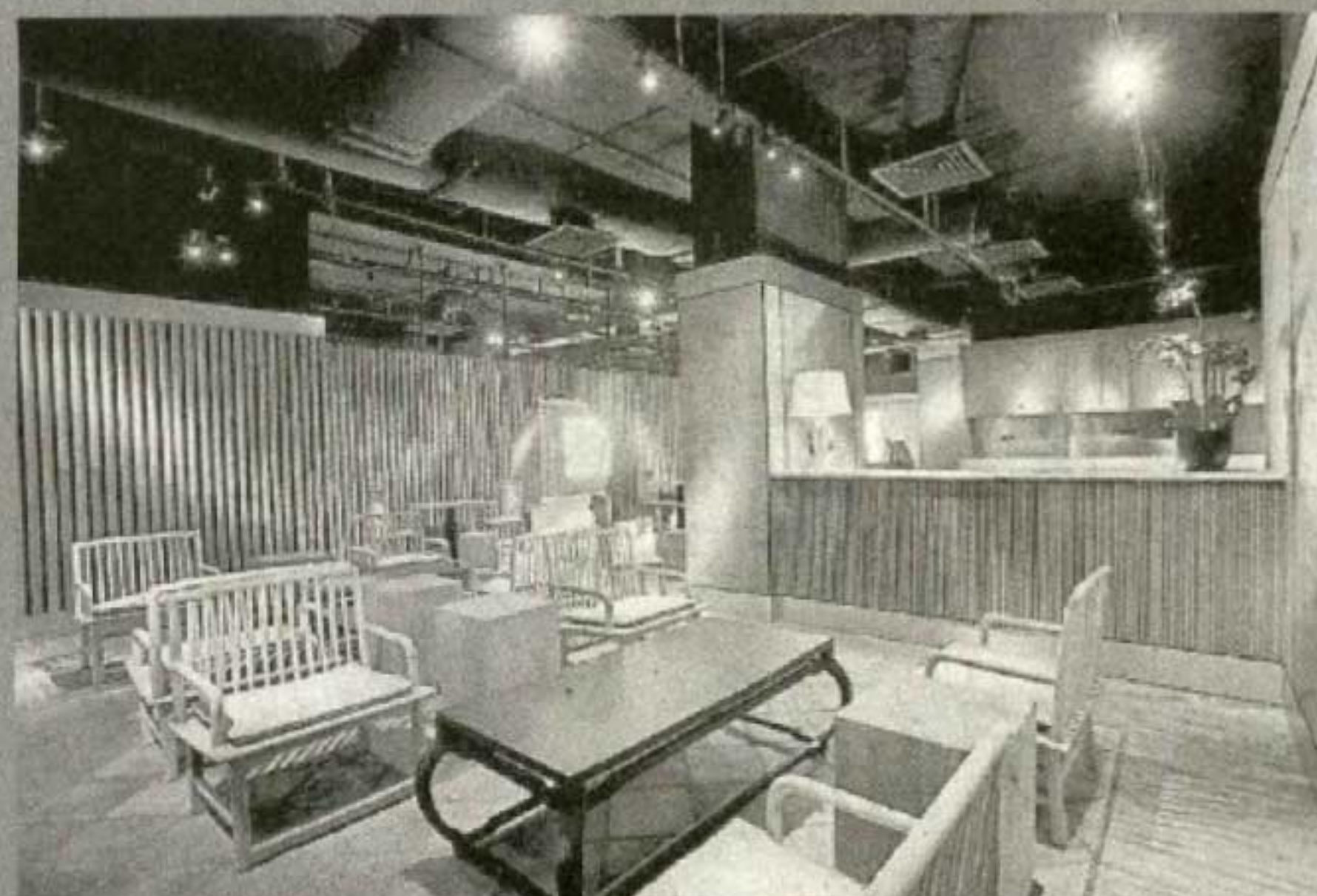
设计现代化的休闲室。

让传统与现代完美邂逅，实现多元化创造力量，使艺术走进生活。檳城时代广场 M MALL O2O 精心打造“郑和文化艺术馆”。