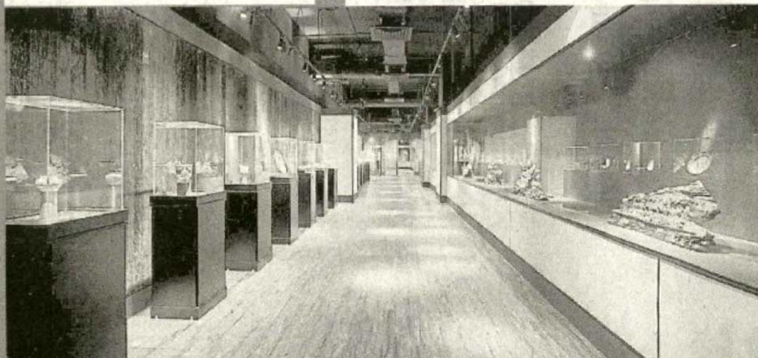
馆中将会展示超过 50 件艺术瑰宝。