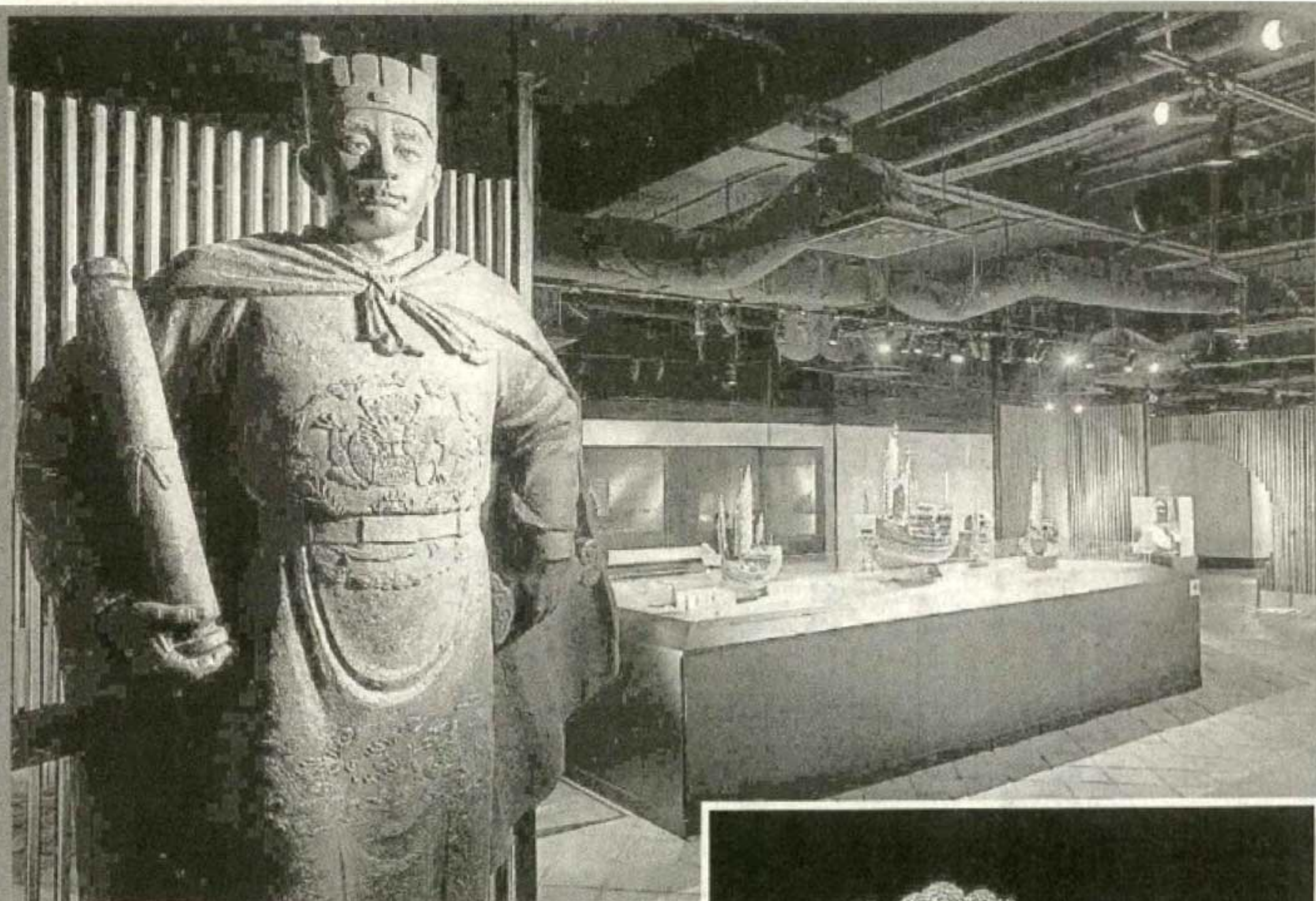
郑和为中国明代航海家、外交家、宦官及武术家。

更多详情： FACEBOOK Huabao Art & Collection INSTAGRAM ChenghoArtculturalcentre.pn